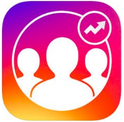
Followers Tracker Pro